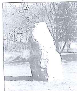
U řeky byl postaven menhir.