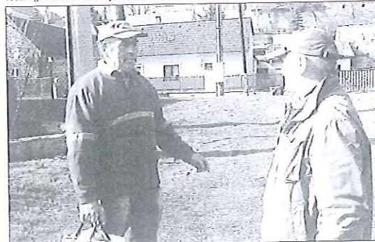
Fotbalovi fanoušci se již těší na sobotní zápas v Měcholupech.