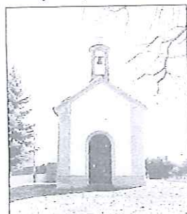
Interiér kaple volá po opravě.

Scházíme k řece. Na mostě je cedula Pila, nabízí krovky, latě hranolý a ukazuje ke mlýnu se zákazem vstu-